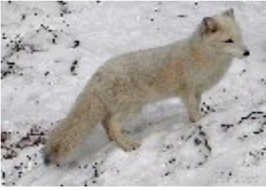
Naali eli Napakettu ( Alopex lagopus )

Pohjoisnapaa ympäröivillä puurajan yläpuolisilla tunturialueilla elävä petoeläin. Kettua pienempi koiraeläin: ruumiin pituus on 55–65 cm, hännän pituus 30–35 cm, paino 3–5 kg, Säkäkorkeus n. 30 cm. Turkki talvisin kokonaan valkoinen ja kesäisin ruskeanharmaa. Tunnusomainen piirre on tuuhea ja valkoinen talvikarvapeite, jonka sanotaan olevan maailman lämpimin karvapeite. Naali on harvinaistunut, eikä ole pesinyt Suomessa enää useampaan vuoteen.