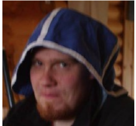
Heikki ja liian iso väiski

Päätoimittaja Mikko Kuusela kuusela@windowslive.com