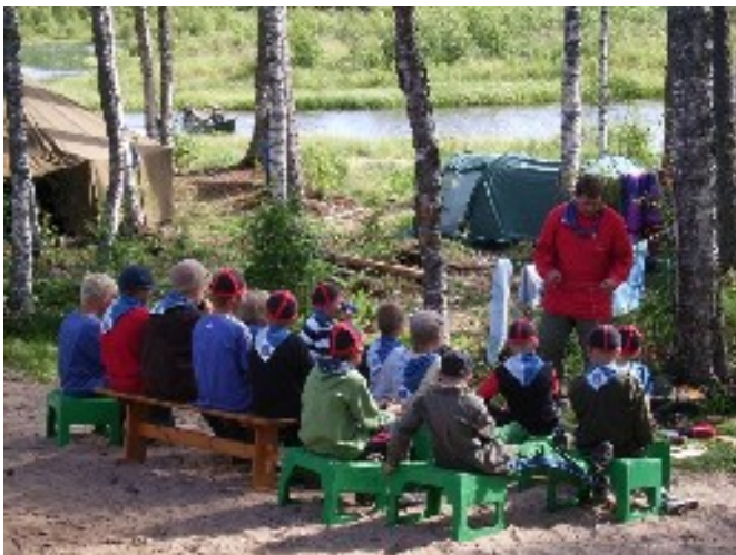
Lauantaina oli erilaisia aktiviteetteja, mm. leivän tekoa nuotiolla, käsitöitä ja melontaa.

Vaikka leirin lyheneminen harmitti monia, hauskaa oli silti.