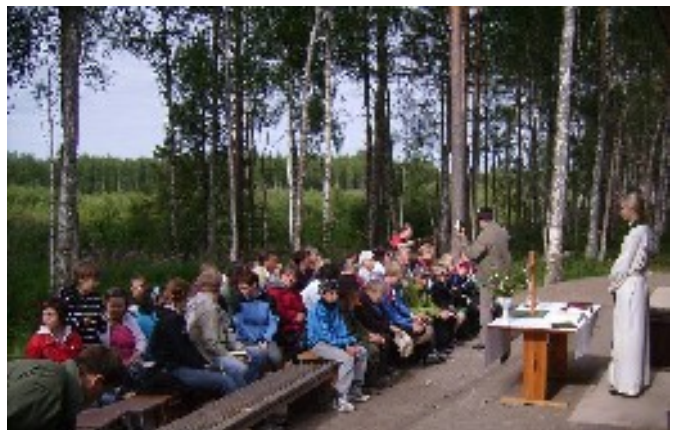
Sunnuntaina leirikirkko oli samalla jumalanpalvelus koko seurakunnalle.

Lisää kuvia ja juttua netissä ja syksyn lippukuntaillassa. HL