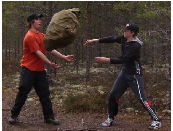
Retken lopuksi kehitimme leikin, jossa heiteltiin kymppitelttä.

set kantoivat koko ajan toukkia, koteloita ja kuolleita muurahaisia saaliina omaan pesäänsä.