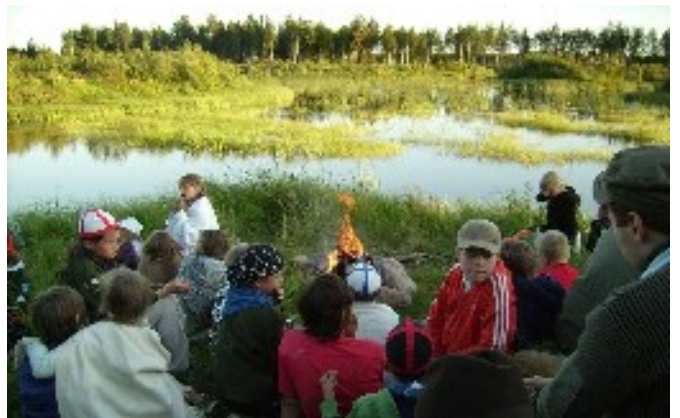
Kumpanakin iltana saunottiin ja vietettiin iltanuotiota.