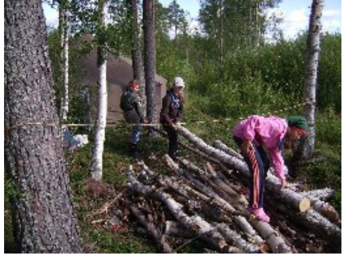
Lapin tytöt keräävät maapuita Pöckelöllä.

Partiokämpä on otettu hyvin käyttöön Niittykärppien eri ryhmissä. Kämpän käyttöä on suunniteltu tehostettavan niin, että hallitus jakaa vartioiden ja laumojen kämppävuoerot syksyllä valmiiksi. Jos vuoroa haluaa vaihtaa, voi kauppoja käydä oman heimon muiden laumojen ja vartioiden kanssa.