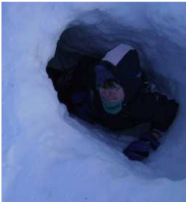
Henri kaivoi hienon lumitunnelin.