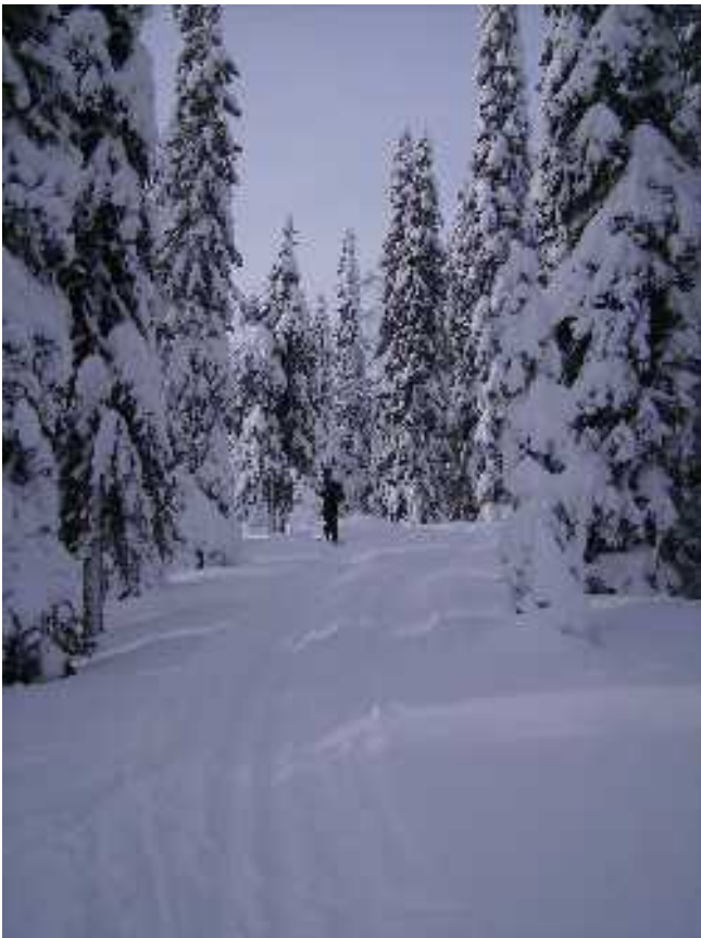
Tykkylumi peitti puut ennen haikkia. Juuri haikin alkaessa tuisku ravisteli puut puhtain.