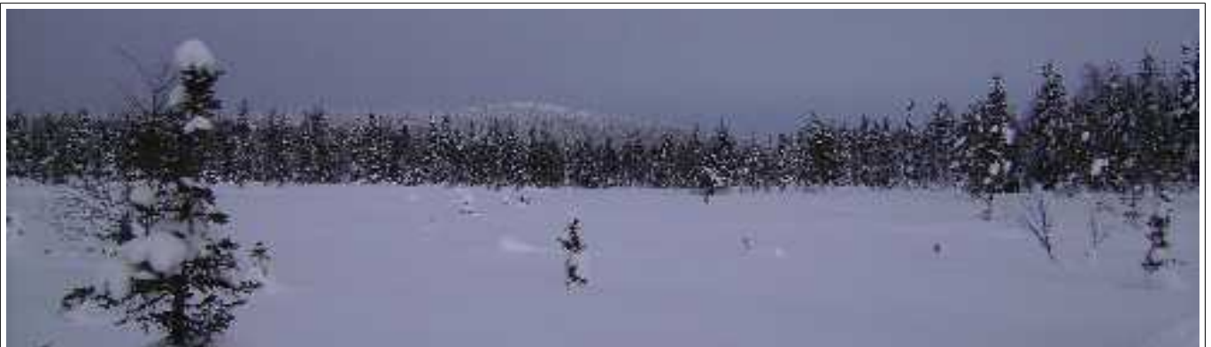
Pidemmältä haikkireitiltä piti olla komeat näkymät pyhitysvaaralle.