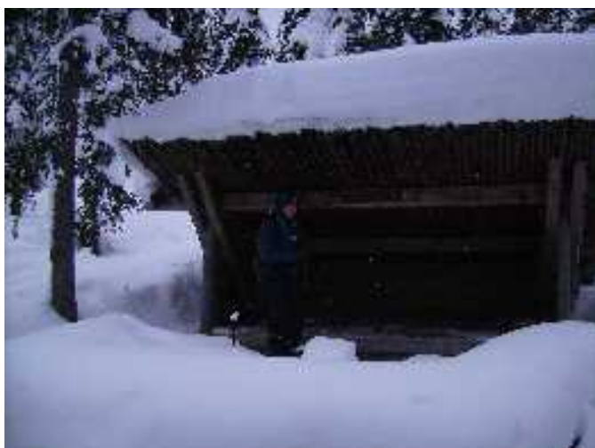
Toinen haikkireitti kulki Pyhitysvaaran laavun kautta.