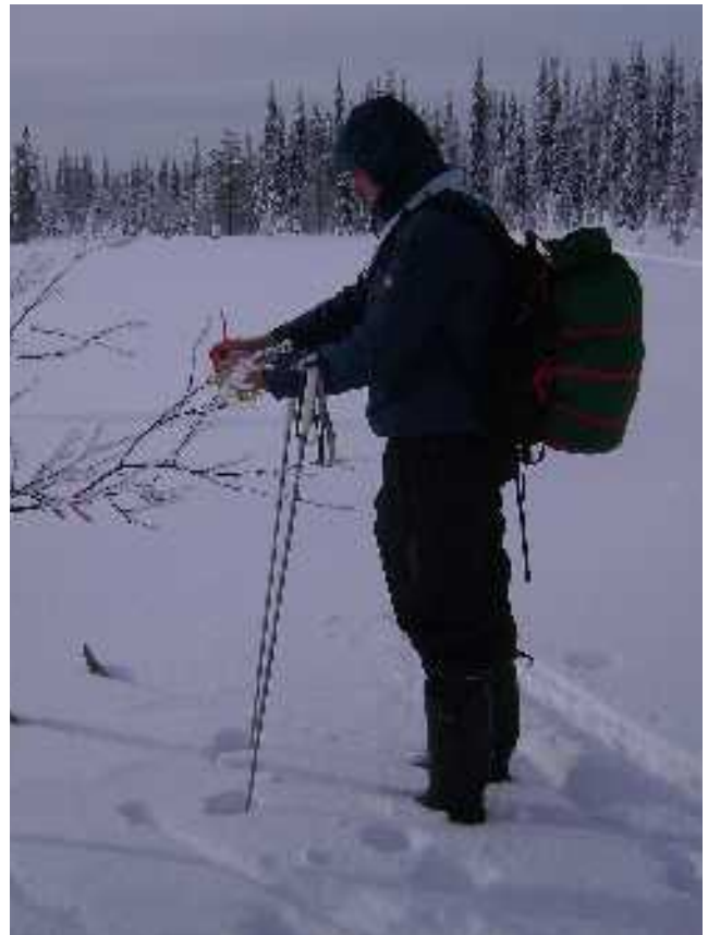
Haikkireitin varrelle merkittiin reittipisteitä, jotka piti sitten löytää kartalta koordinaatteineen.