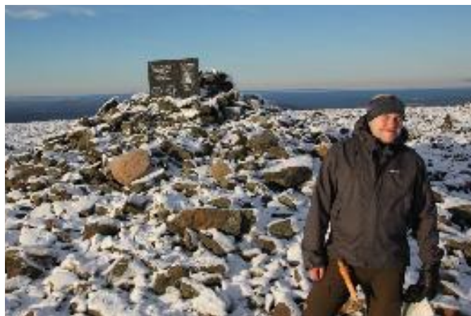
Taivaskerolla syttyi olympiatuli 1952