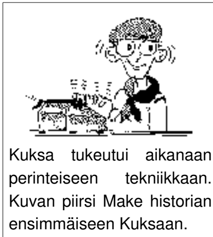
Kuksa tukeutui aikanaan perinteiseen tekniikkaan. Kuvan piirsi Make historian ensimmäiseen Kuksaan.

Joka tapauksessa jo ensimmäinen Kuk- san numero antoi selkeät suuntaviivat lehden tulevaisuudelle niin lehden tyylin,