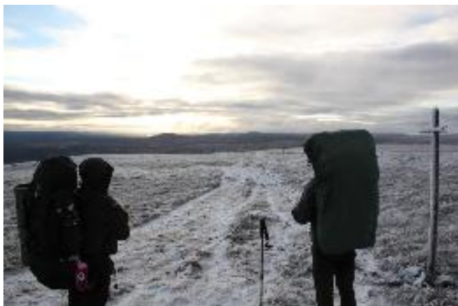
Reitti kulki pitkin tuntureita