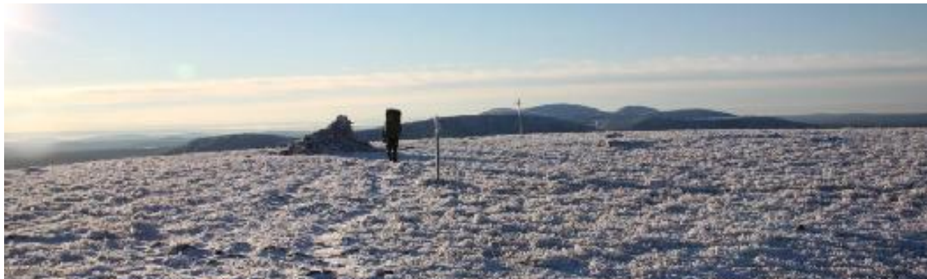
Sää suosi vaeltajia