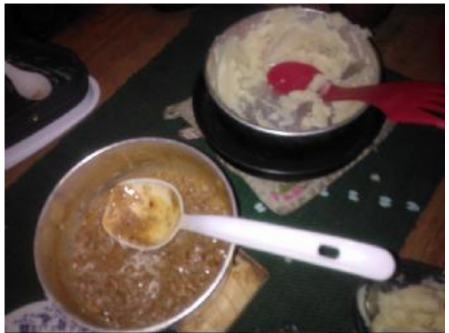
Seitsemän tähden illallinen Huuhkajien yöretkellä.

Jos olisit ollut tekijöiden mukana maistamassa kumpaa tahansa, voisit todistaa lähes laulun sanoin: